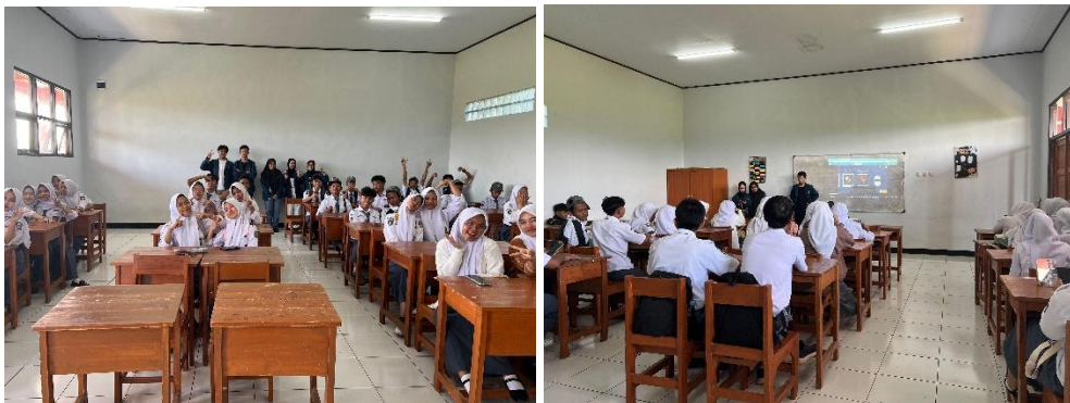
Gambar 3. Dokumentasi