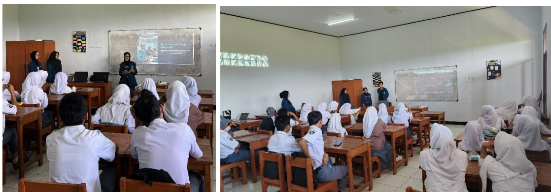
Gambar 4. Proses Pembelajaran