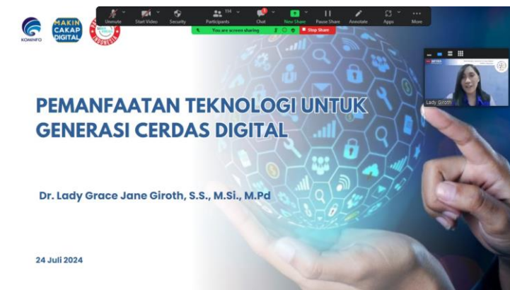
Gambar 1. Dr.Lady Giroth, S.S., M.Si., M.Pd, saat membawakan materi

lunak dan keras dalam lanskap digital, mesin pencarian informasi, aplikasi percakapan dan media sosial serta aplikasi dompet digital, lokapasar dan transaksi digital. Literasi digital melibatkan pengetahuan serta kecakapan pengguna dalam memanfaatkan media digital. Ini mencakup kemampuan untuk menemukan, mengerjakan, mengevaluasi, menggunakan, membuat, dan memanfaatkannya dengan bijak, cerdas, cermat, serta tepat sesuai kegunaannya.